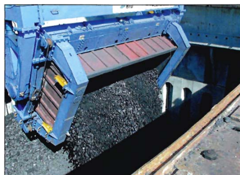
Descarregamento do contentor

descarregamento directamente dentro do compartimento de carga sem qualquer transferências adicionais. Neste caso, não há necessidade de descarregadores de vagão, carros basculantes, montes de reserva etc.