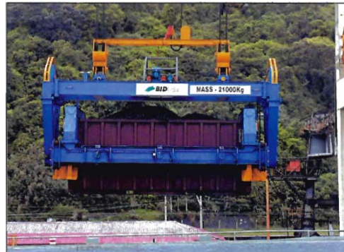
Contentor cheio a ser transportado para o compartimento de carga

A armação interna é manobrado por quatro cilindros hidráulicos (dois de cada lado) e um tipo de arranje com corrente / roda de corrente.