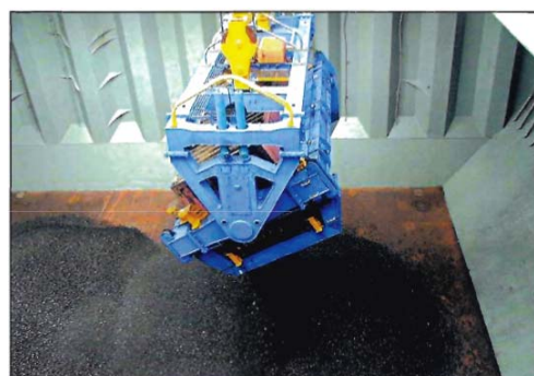
Fim de descarregamento do contentor