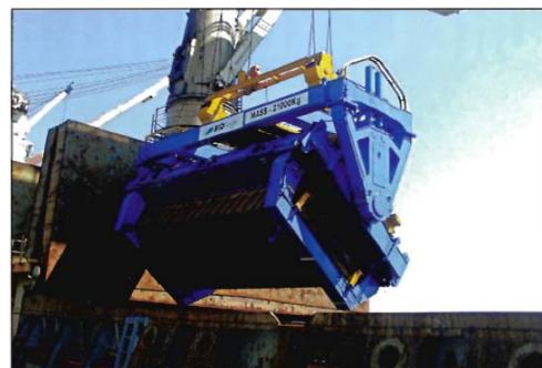
Retornando de contentor vazio para o cais

O sistema também pode ser usado como uma parte do transporte interno, aonde o produto ainda está armazenado no montes de reserva, carregado em contentores usando um carregador simples e transportado para o cais utilizando as instalações existentes de transport.