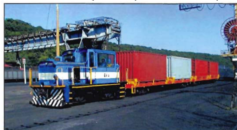
Contentores cheios transportados para o cais

fixação do contentor em posição é feito através da utilização de tipo de fecho de pião.